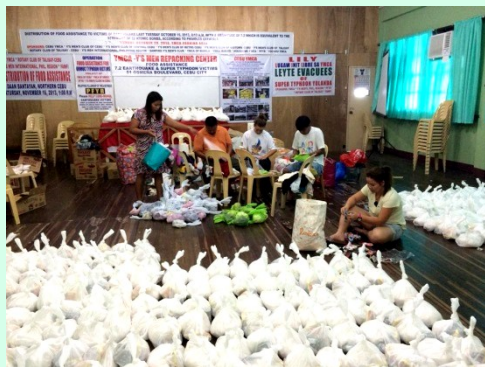
支援物資の袋詰め作業 (セブY)