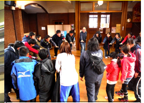
YMCAではおなじみの「チクサクコール」をしていざ、寒風吹きすさぶ盛岡の街へ出陣！