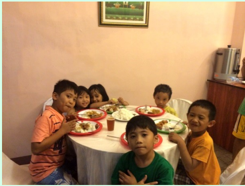
子どもたちに温かい食事を提供 (セブY)

世界各地から送られた募金は、フィリピンYMCA同盟を通して、セブYMCA (セブ島) やイロイロYMCA (パナイ島) など被災地にあるYMCAによる支援活動に送られます。