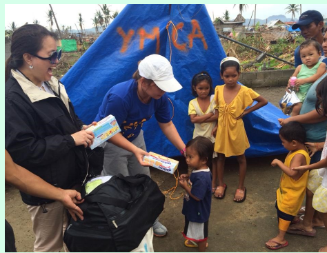
テントを張り、物資を提供 (レイテ島)