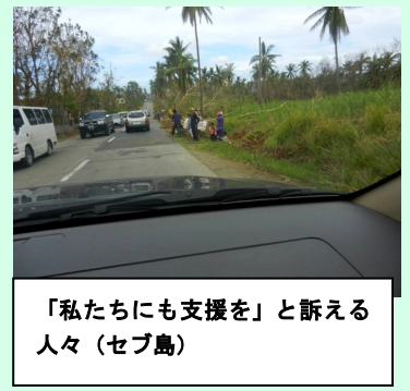
「私たちにも支援を」と訴える人々 (セブ島)