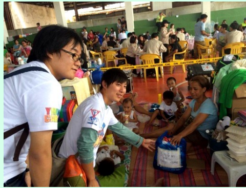
避難所にて物資を提供 (セブ島)